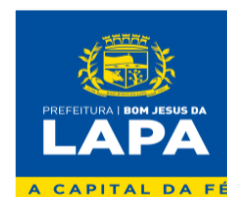
Fabio Nunes Dias Prefeito Municipal CONTRATANTE

PREFEITURA MUNICIPAL DE BOM JESUS DA LAPA – BA Rua Marechal Floriano Peixoto, nº 208 - Sala de Licitação - 1º Andar – Centro – Bom Jesus da Lapa/Ba – Cep: 47.600-000. CNPJ: 14.105.183/0001-14 E-mail: licitacao@bomjesusdalapa.ba.gov.br Tel: (77) 3481-3374 – ramal 216